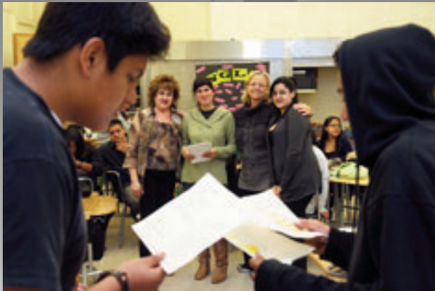
La instrucción personalizada en la Preparatoria LA High School of the Arts acerca a los estudiantes con los maestros, administradores y padres de familia.

Para conocer más sobre las Escuelas Piloto, se invita a los padres, a los socios de la comunidad y a los maestros a