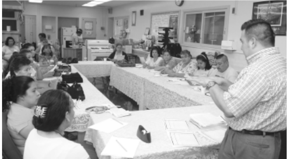
La clase de Nutrición es parte del vasto programa educativo que ofrece el Centro de Padres de la Preparatoria South Gate.

Por Mary Johnson, encargada de promover la participación de los padres, Alianza de Padres de Familia