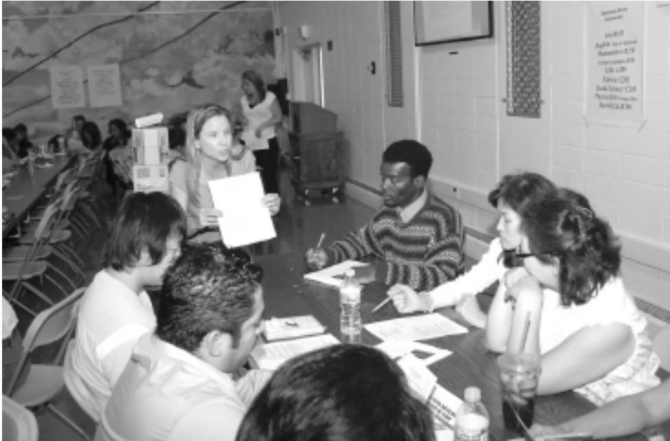
En la Preparatoria Kennedy, los padres trabajan junto a los maestros y al personal en el comité de planificación evaluando la seguridad y salubridad en su escuela.

Cómo respondería a las siguientes preguntas: ¿en qué medida la escuela de su hijo promueve buenos hábitos alimenticios? o ¿de qué manera la escuela notifica a los padres sobre reuniones importantes tales como la Noche de Orientación para Padres? o ¿le proporciona información sobre servicios sociales disponibles?