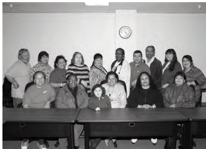
Երեխայի Չարաշահութեան Կանխարգիլում/Ծնողական Ցանցակապային Վարչութիւն