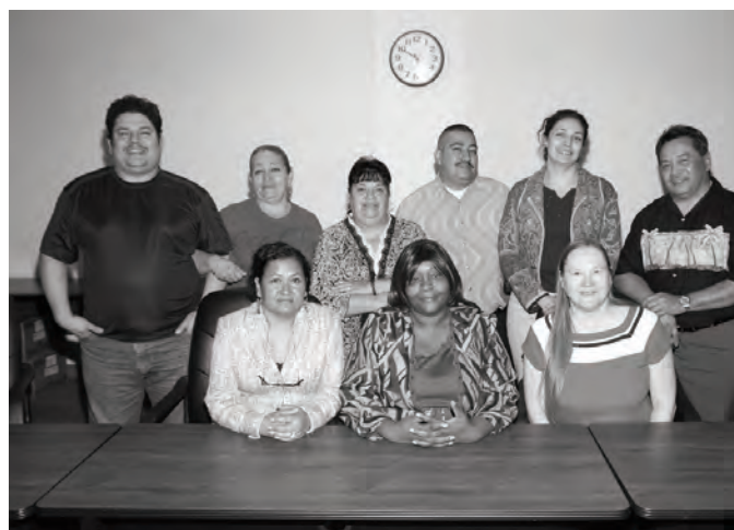
2008 Ծնողական Համագործակցութեան Գործադիր Խորհուրդ: