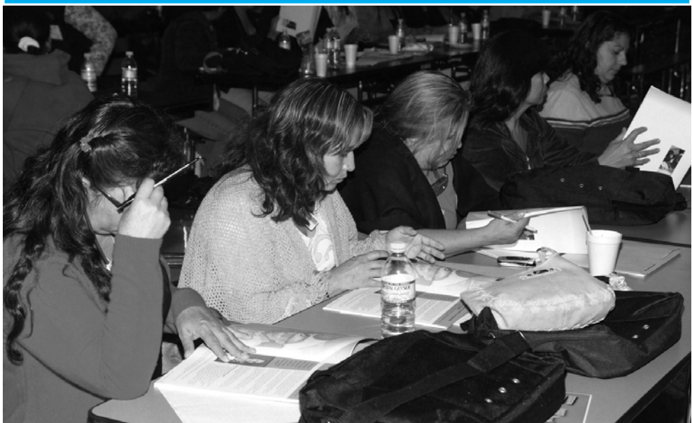
Դպրոցական Շրջանի ծնողները կը դառնան մարզիչներու մարզիչներ, երեխայի չարաշահումը կանխարգիլող գիտիչները իրենց տեղական դպրոցներուն փողանձերով:

Ատր ֎երնագիրն է «Մութն դէպի Լոյս» (Darkness to Light): Ազգային գեղնի վրայ ծանօթ այս ծրագիրը նախագծուած է սորվեցնելու համար ծնողներուն ինչպէս պաշտպանել իրենց երեխաները եւ նուազեցնել երեխայի սեռային չարաշահումը: Վտանքը ակնյայտ է: Ազգային վիճակագրութիւնը ցոյց կու տայ, թէ չորս աղջիկներէն մէկը եւ վեց տղաներէն մէկը գոհերը պիտի դառնան մինչեւ որ 18 տարեկան ըլլան: Զարաշահողները ընդհանրապէս ընտանիքի անդամներ կամ բարեկամներ կը լինեն: Դպրոցական Շրջանի պատասխանատուները պահանջեցին, որ ծնողները համապարփակ վարժութիւն ունենան, եւ «Մութն դէպի Լոյս» աշխատանիստերը սկսան: