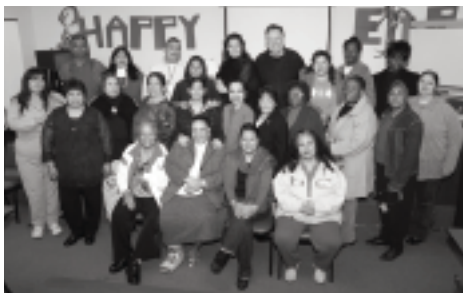
Comité de Planificación de la Cumbre de Padres

Por favor, tome nota de la nueva fecha: 12 de abril de 2008, la cual cambió con respecto a la prevista cuando se publicó el ejemplar anterior de este boletín.