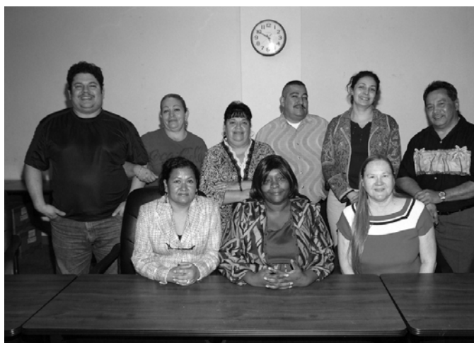
2008년 학부모 연합 간부회.