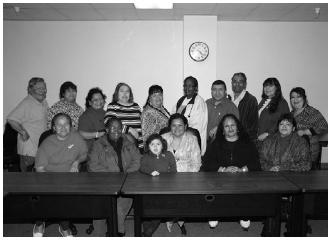
아동학대방지 / 학부모 네트워크 훈련.