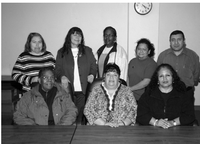
Tiểu Ban Truyền Thông Liên Lạc.

Những phụ huynh hăng hái này thúc giục mọi phụ huynh tham gia ở mọi chỗ và mọi lúc họ có thể: ở cấp Học Khu, ở Học Khu Địa Phương, ở trường nhà của quý vị, và tại nhà. Con cái của quý vị sẽ là những người được lợi.