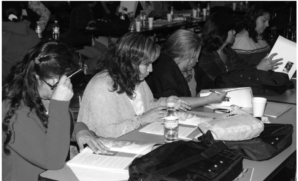
Phụ huynh ở khắp Khu Học Chánh đang trở nên huấn luyện viên của các huấn luyện viên khi họ học cách để chia sẻ chương trình ngăn ngừa xâm hại trẻ em tại các trường địa phương.

T ựa đề của nó là “Từ Tối qua Sáng” (Darkness to Light) Chương trình được cả nước biết đến này được soạn để dạy phụ huynh cách bảo vệ con cái họ và giảm bớt sự xâm hại tình dục trẻ em. Mỗi đe dọa là lớn. Thống kê toàn quốc cho thấy rằng một trong bốn em gái và một trong sáu bé trai sẽ là nạn nhân cho đến lúc họ đạt 18 tuổi. Những kẻ xâm hại thì hầu hết là thành viên trong gia đình hoặc bạn bè. Các quan chức Khu Học Chánh đã yêu cầu huấn luyện toàn diện cho phụ huynh, và các buổi học hội “Darkness to Light” đã bắt đầu.