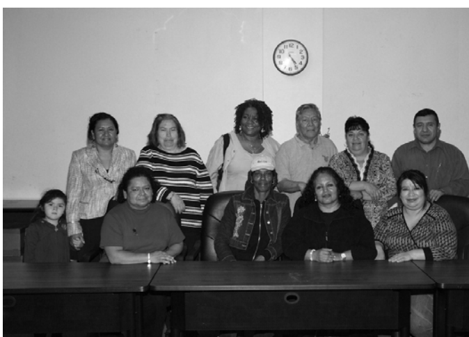
Tiểu Ban Ngân Sách.